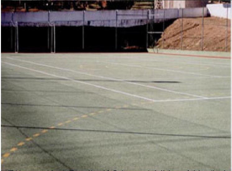
Estreito (An) e o equipamento (pública) de futebol de 11, cantão, patim, e bequei em Faro do Alentejo Faro do Alentejo Campo de Futebol 11