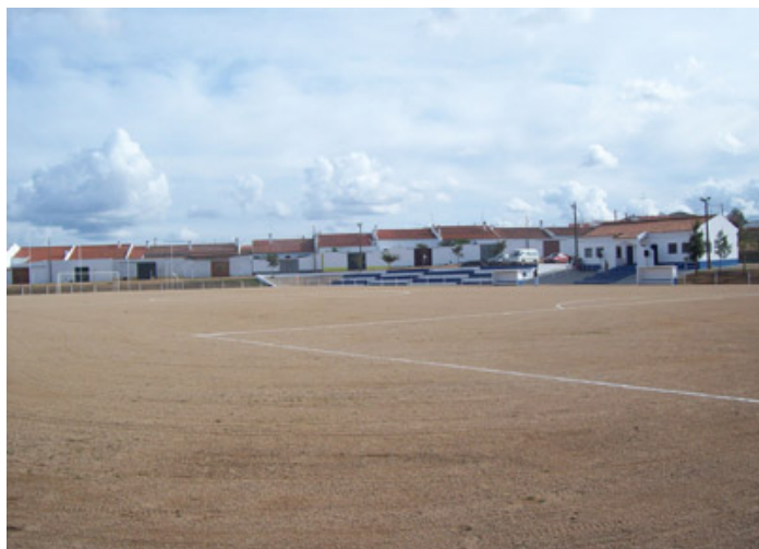
6. Cam. Grupo Desportivo e Fátima de Futebol do Alentejo, com a equipa de futebol de 1.ª jornada Polidesportivo