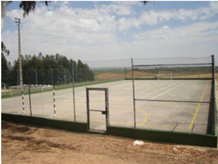
Vila Ruiva Campo de Futebol 11