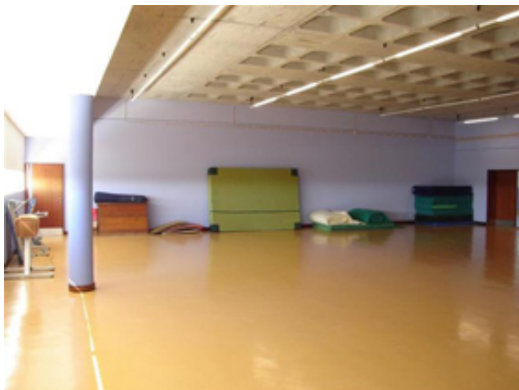
Campo de Futebol Amado Aguilar