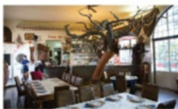
Interior da taberna de Chão Frito, com uma decoração simples e acolhedor.

Esta taberna tem um ambiente muito agradável, com uma decoração que remete para os tempos antigos. A taberna é conhecida por ser um espaço onde se pode encontrar a melhor comida e vinho da região. O Chão Frito é um espaço onde se pode encontrar a melhor comida e vinho da região.