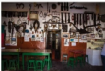
Interior da taberna de Chão Frito, com uma decoração simples e acolhedor.

Chão Frito é uma típica cantina de Cuba, cheia de vida e alegria. O ambiente é simples e acolhedor, com uma decoração que remete para os tempos antigos. A taberna é conhecida por ser um espaço onde se pode encontrar a melhor comida e vinho da região. O Chão Frito é um espaço onde se pode encontrar a melhor comida e vinho da região. O Chão Frito é um espaço onde se pode encontrar a melhor comida e vinho da região.