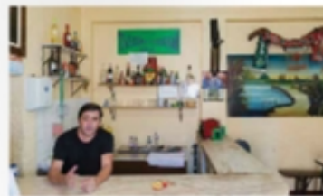
Interior da taberna de Mãos, com uma decoração simples e acolhedor.

Taberna de Mãos é uma típica cantina de Cuba, cheia de vida e alegria. O ambiente é simples e acolhedor, com uma decoração que remete para os tempos antigos. A taberna é conhecida por ser um espaço onde se pode encontrar a melhor comida e vinho da região. O Chão Frito é um espaço onde se pode encontrar a melhor comida e vinho da região.